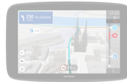
GO Navigator 2. Generation