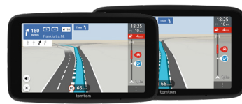
GO Classic 2. Generation

Das TomTom GO Classic der zweiten Generation ist Ihr kostengünstiger Navigationspartner mit hochwertigen TomTom-Karten (inklusive Updates für Europa) und zuverlässigem TomTom Traffic. Das GO Classic umfasst jetzt monatliche Karten-Updates, 3 Routenoptionen, einen dynamischen Fahrspurassistenten und einen USB-C-Anschluss (Branchenstandard). Verglichen mit der vorherigen Generation bietet der interaktive Touchscreen jetzt eine noch höhere Auflösung und Qualität, damit Sie keine Abbiegung oder Warnung mehr verpassen. Das GO Classic ist ein umfassendes TomTom-Pkw-Navi zu einem kostengünstigen Preis.